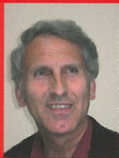
JOHANN, DER BUTLER HANS WILHELM